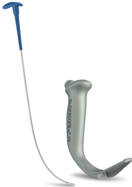
Figur 1. GlideRite stiv mandreng og det gjenbrukbare GlideScope Titanium-videolaryngoskopet

GlideRite stiv mandreng er spesifikt utformet for å fungere med GlideScope-videolaryngoskoper. Vinkelen på GlideRite stiv mandreng utfyller den unike vinkelen på GlideScope-instrumentet for å lette rask plassering av en endotrakealtube og for å bidra til å redusere pasientens traume.